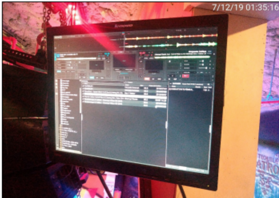
Fotografía No 32. Monitor Lenovo. Ubicado en el quinto nivel