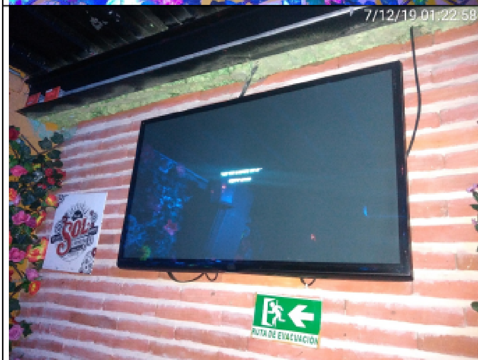
Fotografía No 13. Televisor sin marca, 2 unidades. Ubicados en el cuarto nivel